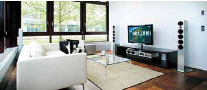
Revox Multiroom with Feller wall controller and KNX bus buttons; both in the universal EDIZIOdue design with prestige frames in brush finish stainless steel