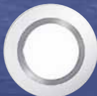
CRAYON: LED-Downlight für eine energieeffiziente Allgemeinbeleuchtung