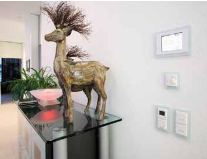
Feller wall controller for Revox Multiroom, KNX buttons, thermostat and Touch panel; all in the universal EDIZIOdue design with prestige frames in glass