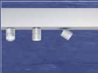
SUPERSYSTEM: LED-Hybrid Leuchtensystem für komplexe Beleuchtungsaufgaben

Intelligente Lichtlösungen von Zumtobel sind in perfekter Balance von Lichtqualität und Energieeffizienz – in HUMANERGY BALANCE.