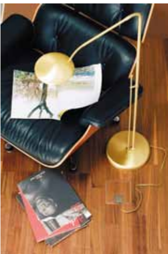
Connections without cable clutter: Feller floor socket with cover for inserting the floor covering. Can be equipped for 230 V, R/TV, multimedia, telephony, networks etc.

Today, flexible multi-room music and multimedia systems are increasingly being incorporated right at the building stage. Reason enough for Revox and Feller to strengthen a successful partnership. Revox as trendsetter in music reproduction for over 60 years, Feller as market-leaders in electrical installation.