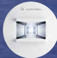
RESCLITE: Die Power-LED für neue Massstäbe in der Sicher- heitsbeleuchtung