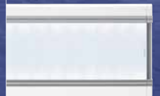
AERO II: LED-Hybrid für die innovative effiziente Beleuchtung von Büroarbeitsplätzen